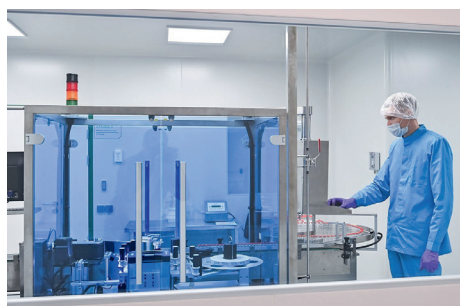
Рис.3. На заднем фоне – беспроводной датчик температуры и влажности.