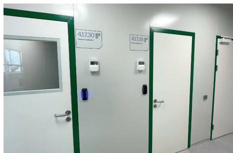
Рис. 2. Узлы «ПИРС-CAN», отображающие показания датчиков дифференциального давления