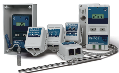
Рис. 4. Линейка датчиков ИПМ. Внесены в реестр СИ РФ №83449-21

– Установленная на заводе «Р-Опра» система мониторинга микроклимата «Гигротермон» контролирует параметры температуры, сверхнизкой температуры, относительной влажности и дифференциального давления воздуха. В качестве датчиков применены сертифицированные климатические датчики из линейки ИПМ.